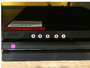
圖 2 光碟進片入口

Step #4 遊戲結束，請按圖 3 紅色箭頭處將光碟退出，拿至 5 樓櫃台歸還。