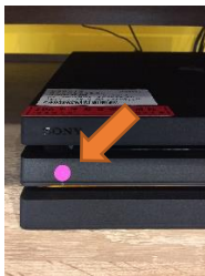
圖 1 PS4 電源開關