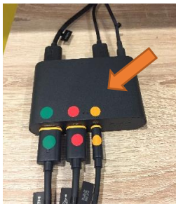
圖 1 控制盒

Step #3 將 Vive 頭盔的三合一訊號線插入主機櫃上方的「控制盒」(圖 1)，並按下 2 支手把的電源按鈕(圖 2)。