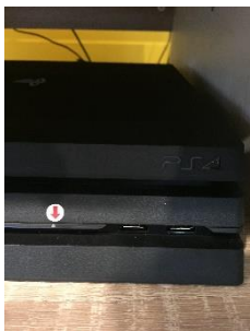
圖 3 光碟退片按鍵