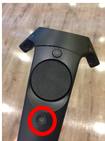
圖 2 手把電源